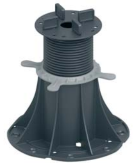
Опора 120-220 мм