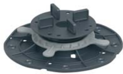
Опора 30-45 мм