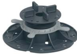
Опора 45-70 мм