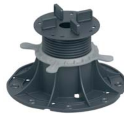
Опора 70-120 мм